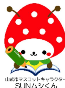
山武市マスコットキャラクター SUN△シくん