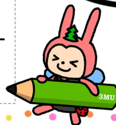
山武市経済・産業活性化キャラクター むーちゃん

特定非営利活動法人又はボランティア団体等の任意団体であり、市民の自発性に基づき、様々な分野で自立的・継続的に社会貢献活動を行う営利を目的としない団体です！