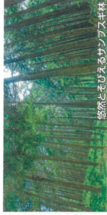
悠然とそびえるサンブスギ林