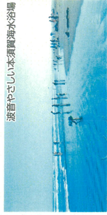
波音やさしい本須賀海水浴場