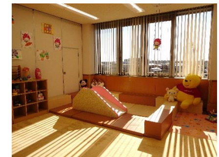
成東保健福祉センター3階 はぴねすルーム