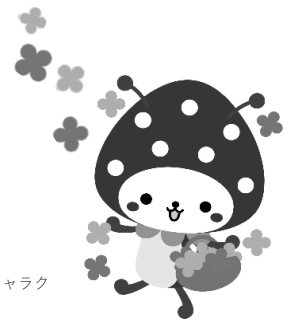
山武市マスコットキャラクター

有給・・・忌引、夏季休暇、 結婚休暇など 無給・・・子の看護休暇、 病気休暇など