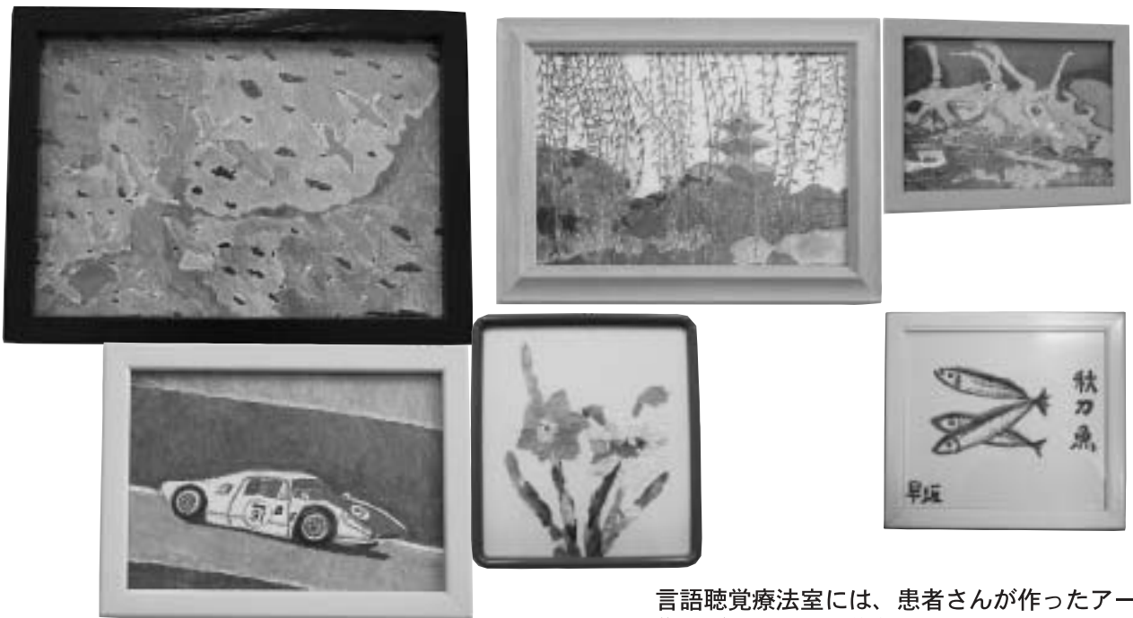
言語聴覚療法室には、患者さんが作ったアート作品が、部屋中に飾られている