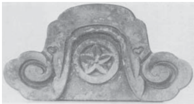
※注二 太田家の家紋「丸に桔梗」の鬼瓦

松尾城の名前の由来ですが、旧領地掛川藩時代の居城・掛川城の別称・松尾城に由来します。また資美の藩邸の置かれた桔梗岡の名前も、太田氏の家紋「丸に桔梗」(注二、写真)に由来しています。