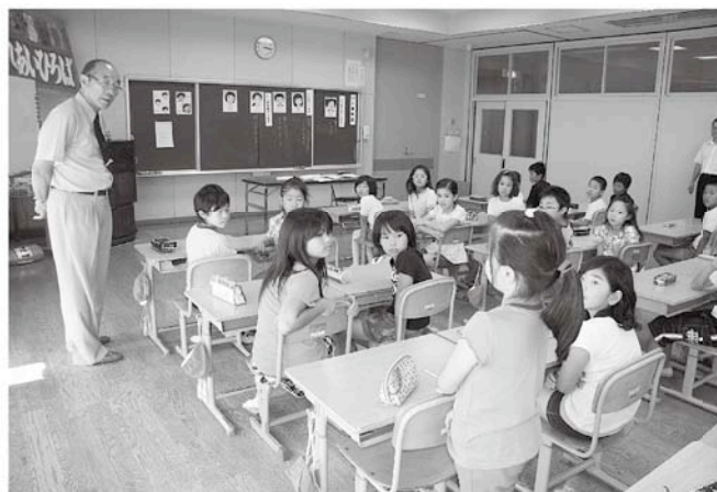
啓発ビデオの登場人物を黒板に貼り出し、「それぞれが何を考えていたか」の質問に、児童は感じたことを活発に答えました