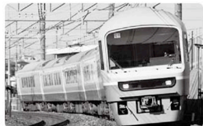
お座敷列車 ニューなのはな号

期 日 平成21年11月12日(木)～13日(金) 1泊2日 費 用 37,000円 宿 泊 先 奥飛騨温泉 穂高荘山のホテル 募集人員 180人 申・問 JR東日本テレフォンセンター ☎050(2016)1602 後 援 山武市 ☎(80)1131