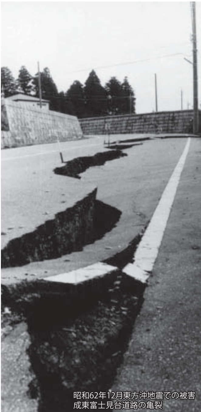
昭和62年12月東方沖地震での被害 成東富士見台道路の亀裂

※山武市ホームページ (URL http://www.city.sammul.g.jp ) をご覧ください。