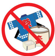
祭事への寄附や 差し入れ