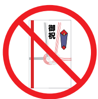
結婚祝 (自ら出席する場合は除く)