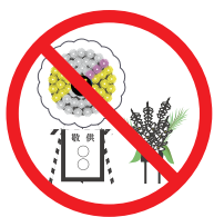
葬式の花輪・供花