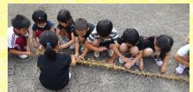
タケノコの根の観察