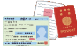
ざいりゅうかーど 在留カード ばすぽーと パスポート