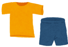
ようふく したぎ 洋服・下着