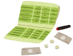
きちょうひん (つうちょう 貴重品 (通帳など)