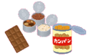
ひじょうしょく 非常食