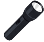
かいちゅうでんとう 懐中電灯