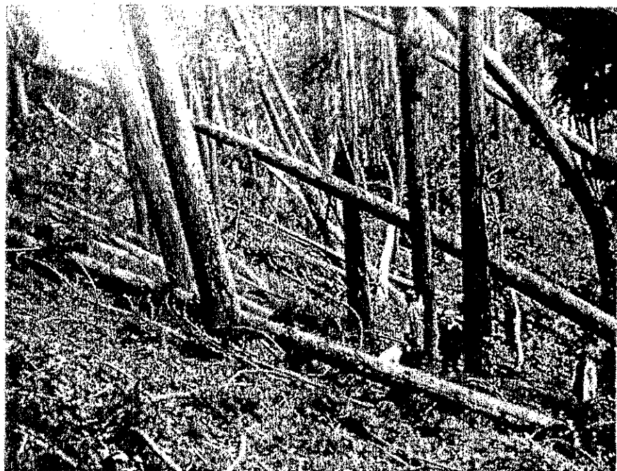
明治35年9月の暴風雨で倒れた杉（下布田）