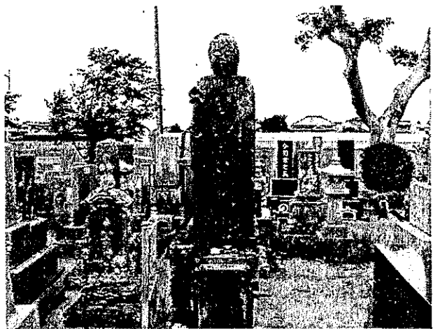
元禄津波による被害の様子を今に伝える百人塚