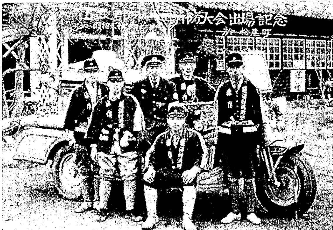
昭和30年、消防大会に出場した蓮沼村消防団