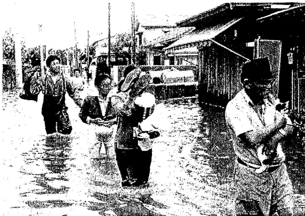
昭和46年、台風25号による浸水被害 猫も男性に抱えられながら避難（右手前）