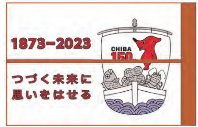
▲田んぼアート絵柄イメージ図