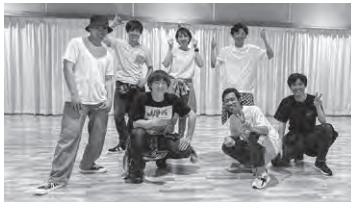
山武市役所ダンス部活動中