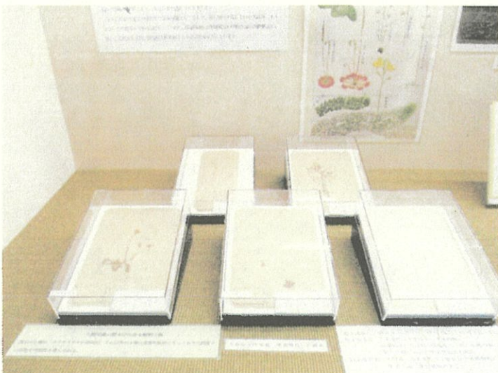
明治36年採集植物標本