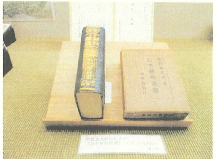
牧野富太郎著「日本植物図鑑」