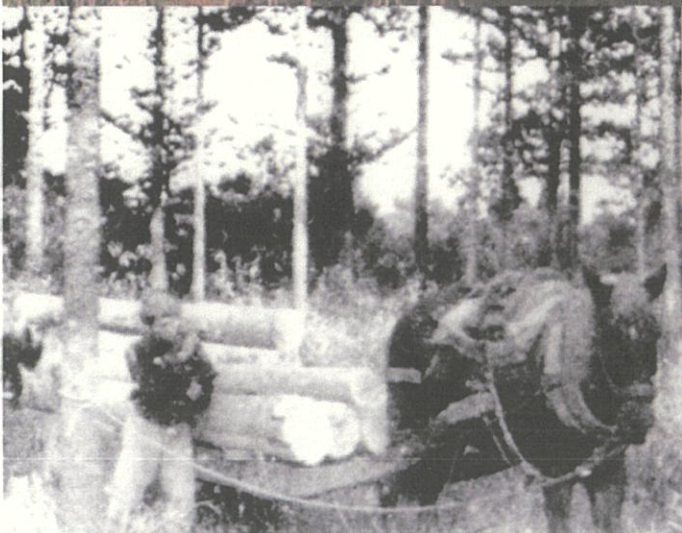
馬車による運び出し