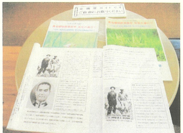
令和2年度の国指定100周年展示解説資料