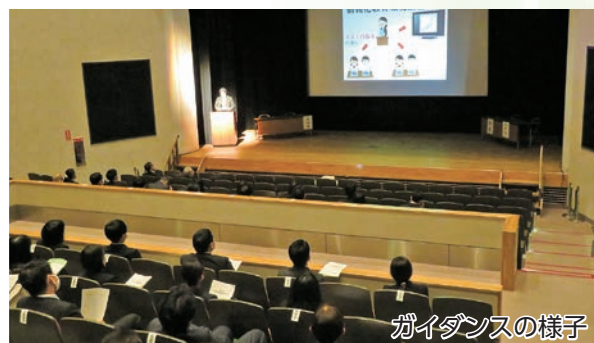
ガイダンスの様子