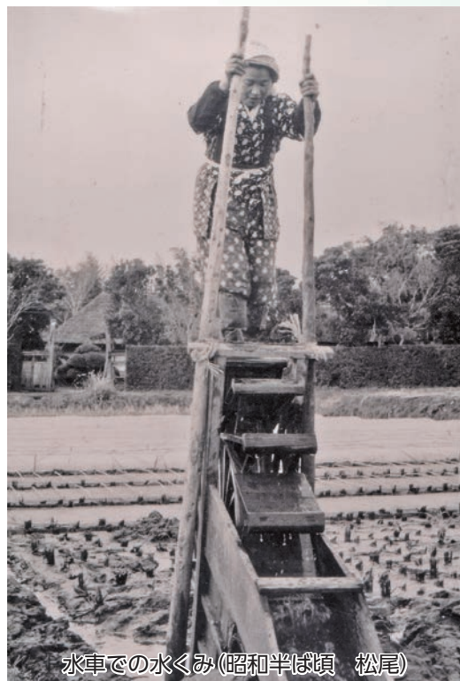
水車での水くみ(昭和半ば頃 松尾)

期 間 令和5年5月9日（火）から 令和5年9月24日（日）まで ※令和5年9月26日から 10月6日までは展示替え休館。 開催場所 山武市歴史民俗資料館 企画展示室