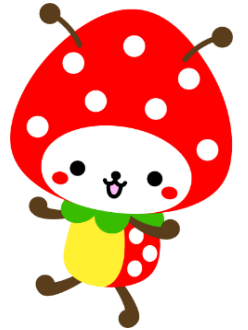
山武市マスコットキャラクター SUNMUSHIKUN