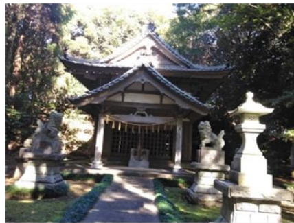
大堤権現塚古墳 箱根神社

山武市は2006年(平成18年)に成東町・蓮沼村・松尾町・山武町が合併して誕生しました。合併により、海岸・平地・丘陵地帯と様々な特徴を持った市となりました。住んでいる地区ではない地区に行ってみると山武市の新しい魅力を発見できるかもしれません。