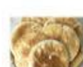
せんべい 1枚半弱 (18g)