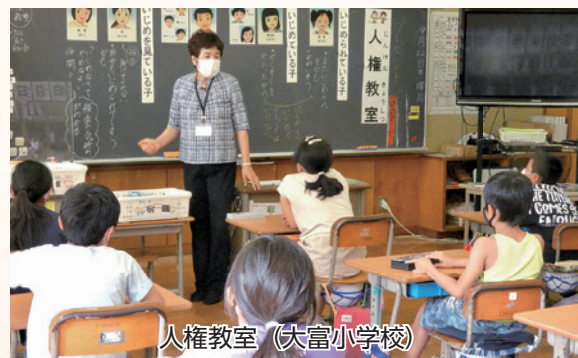
人権教室（大富小学校）