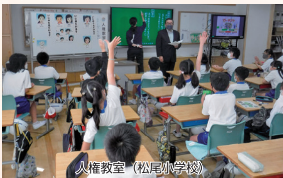
人権教室（松尾小学校）

子どもが多くの時間を過ごす学校や園の教職員は、こどもの変化に気づきやすく児童虐待を発見しやすい立場にあり、児童相談所への通告の義務が定められています。