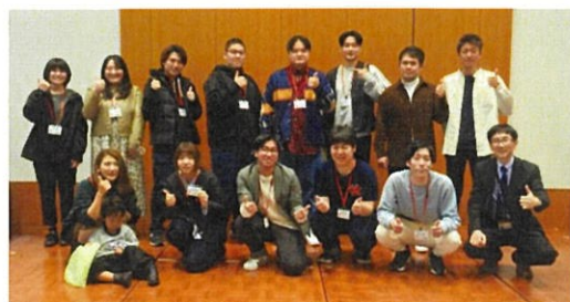
「山武市応援隊」を委嘱された卒業生