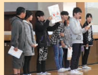
各小学校からの自己紹介