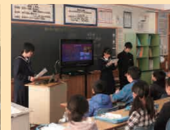
職場体験学習の発表