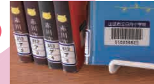
本の管理(バーコード)