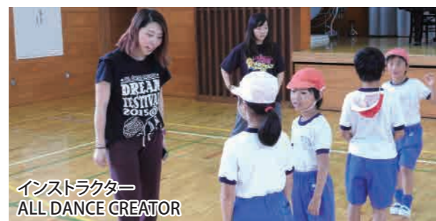
インストラクター ALL DANCE CREATOR

内容 オリジナルダンス [ヒップホップダンス] の作成 オリジナル曲の作成 『ONE TO SUN-MU』 (ワンツーサンム) ~S-Dream 未来へ~