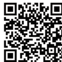
山武市教育委員会の ホームページのQRコード