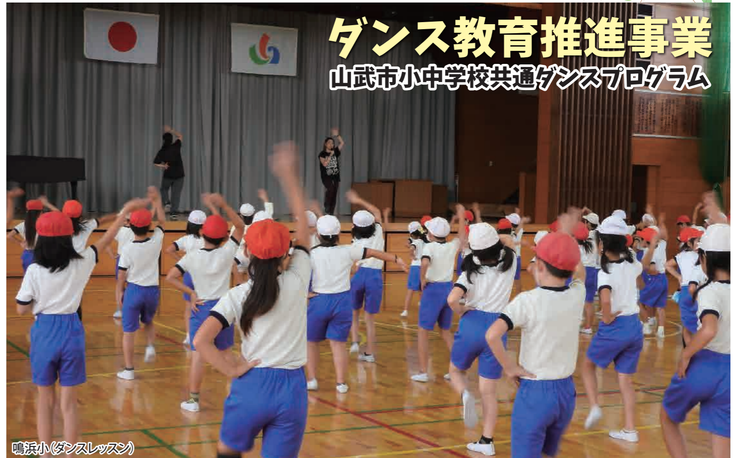
鳴浜小(ダンスレッスン)