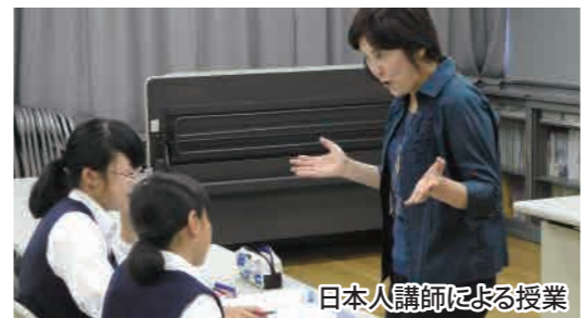
日本人講師による授業

グローバル教育の推進に向け、市内の中学2・3年生を対象に英語力の向上を図り、国際感覚を身につけた人材を育成するため、英語力アップ講座を、今年度から実施しています。英検受験に向けての集中講義となります。