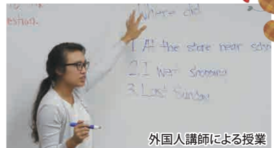
外国人講師による授業

さまざまな競技にふれ、ボールを使う運動の楽しさを体験してみよう！ 日本トップリーグ連携機構に所属するトップアスリートと一緒にボールを使って遊んだり、様々な種目にチャレンジしたりするイベントです。 ●日時：11月6日(日) ●場所：さんぶの森中央体育館・さんぶの森ふれあい公園多目的広場 ●種目：【午前の部】ボールで遊ぼう 親子でボールを使って遊びます 【午後の部】キッズチャレンジ サッカー、バレーボール、バスケットボール、ホッケーを体験します ●参加資格： 【午前の部】 40組 80名 幼稚園年中～小学3年生とその保護者 【午後の部】 120名 小学4年生～6年生 ●申込方法や申込期間は講師が決定次第、改めてお知らせします。 ●問合せ先：スポーツ振興課 Tel.0475-80-1461