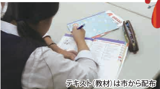
テキスト(教材)は市から配布