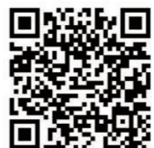
山武市教育委員会のホームページのQRコード