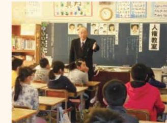
松村委員による人権教室 (成東小4年生)

千葉人権擁護委員協議会山武支部会では、他人に対する思いやりや優しさの重要性について、小学3、4年生を対象に人権教室を実施しています。市内小学校13校で6~12月に、各地域の人権擁護委員が授業を実施しました。