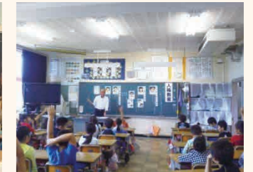
秋葉委員による人権教室 (松尾小3年生)