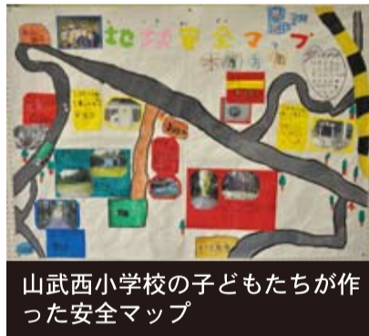
山武西小学校の子どもたちが作った安全マップ

平成24年7月3日(火)、登下校時に子どもが被害者となる犯罪の発生が後を絶たないことから「地域で子どもを見守る活動支援集会所」が開かれました。山武西小学校、日向小学校における防犯への取り組みが発表されました。