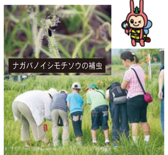
ナガバノイシモチソウの補虫

平成24年7月3日(火)、登下校時に子どもが被害者となる犯罪の発生が後を絶たないことから「地域で子どもを見守る活動支援集会所」が開かれました。山武西小学校、日向小学校における防犯への取り組みが発表されました。