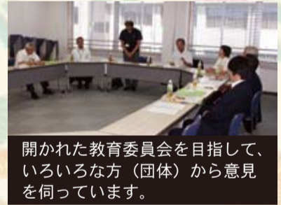
開かれた教育委員会を目指して、いろいろな方(団体)から意見を伺っています。

平成24年8月16日(木)、教育委員会は市長、副市長を交えてあるべき教育について意見交換を行いました。