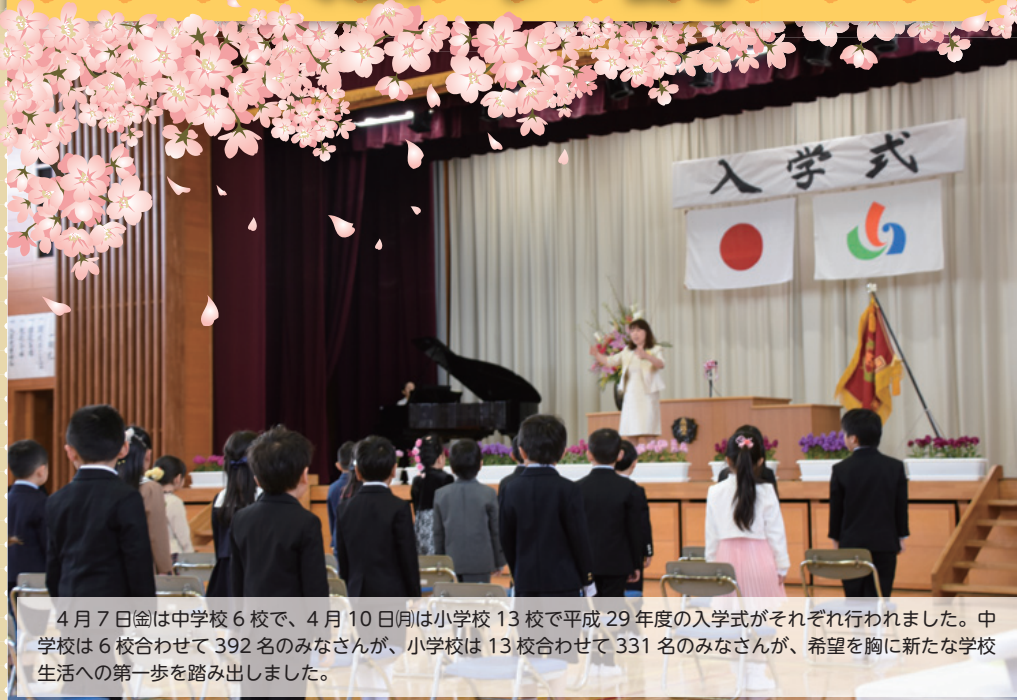
4月7日(金)は中学校6校で、4月10日(月)は小学校13校で平成29年度の入学式がそれぞれ行われました。中学校は6校合わせて392名のみなさんが、小学校は13校合わせて331名のみなさんが、希望を胸に新たな学校生活への第一歩を踏み出しました。