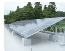
太陽光パネル(成東中学校)