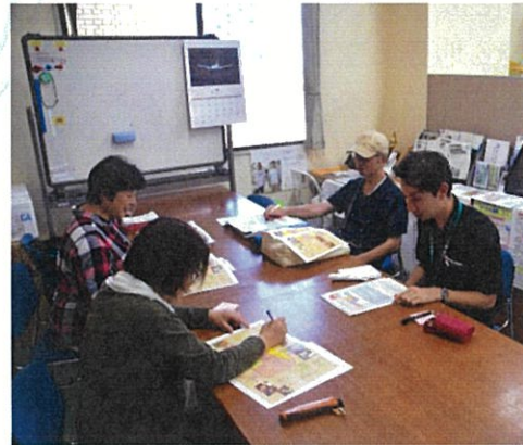
楽しく打ち合わせしています！