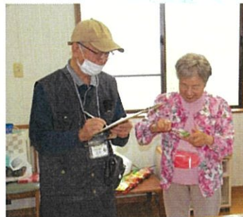
市民の方を取材しています