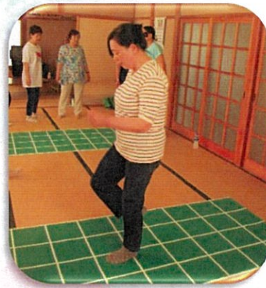
スクエアステップ

開設年月日:平成 25 年 4 月 活動拠点:南八区区民館 活動回数:年 4 回 登録役員数:4 名