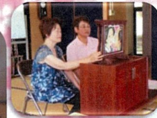
ボランティアの方々による紙芝居

開設年月日:平成 12 年 4 月 活動拠点:豊岡地区 活動回数:年 4 回 登録役員数:19 名