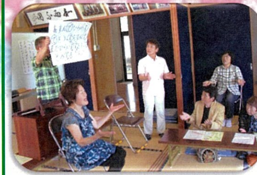
振り付けも交えて歌いました!