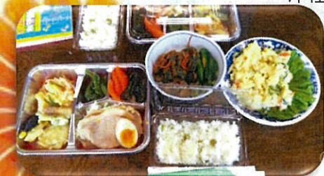
栄養バランスを考えた 手作り弁当