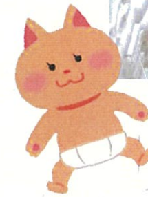
取材時に活動していた ボランティア団体「ともしび」