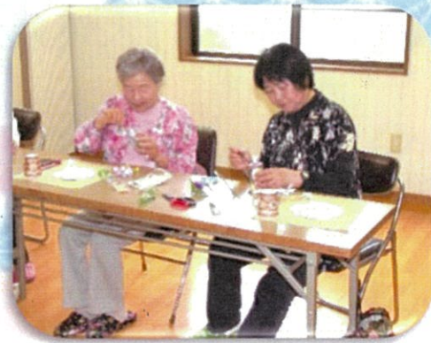
ボトルに花をきれいに 入れるのがむずかしい!