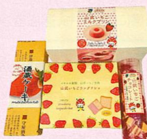
苺スイーツセット