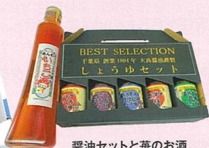
醤油セットと苺のお酒