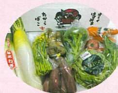
オライ野菜詰め合わせ