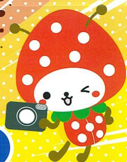
山武市マスコットキャラクター SUNMシくん