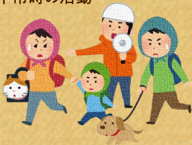
避難訓練・救助訓練