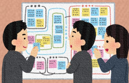
地域住民の安否に関する情報収集