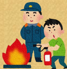
消防署からの指導