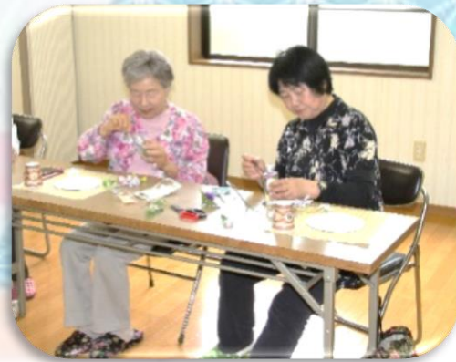
ポトルに花をきれいに 入れるのがむずかしい!

参加者は「サロンが開かれるたびに、他のメンバーとより親しくなり、内容も充実してきた。これからも続けてほしい」と話しています。