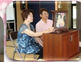
ボランティアの方々による紙芝居