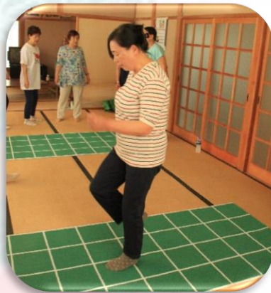
スクエアステップ

開設年月日:平成 25 年 4 月 活動拠点:南八区区民館 活動回数:年 4 回 登録役員数:4 名