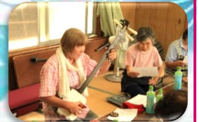
津軽三味線にあわせて 歌いました

「ふれあいサロンあじさい」では、食事会、輪投げ、サロンメンバーによる紙芝居や三味線伴奏などが行われていました。