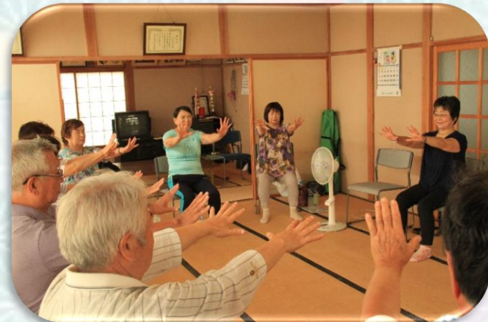
普段動かさない肩回りもよく伸びる!

「南八区いきいきサロン」では、食事会や日帰り旅行、クリスマス会などを行っています。取材の際は食事会や、講師を招いての脳トレ健康体操・スクエアステップ(マス目に沿ってステップする運動)、笑いヨガ(笑いながら体を動かすエクササイズ)などを通して、参加者の交流を図っていました。