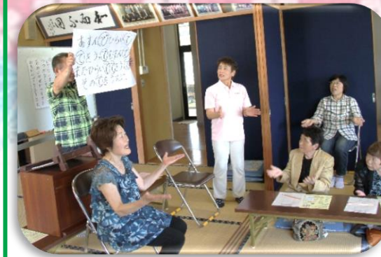
振り付けも交えて歌いました!