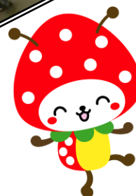
山武市マスコットキャラクター SUNMUSHIKUN

ご神木の箸づくり/エコバッテリー車の試乗展示/花・イチゴ苗の販売/ペレットストーブ展示/バイオマスプラスチックの展示販売/積み木販売/野菜販売/甘酒販売/チヂミ販売/トン汁販売/米粉麺販売/もちつき販売/手作り小物販売/スープ・ホットドッグ販売/ボランティア相談/焼きそば販売、他