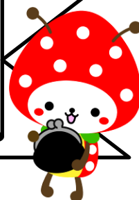
山武市マスコットキャラクター SUN△シくん

日時 2月2日(土) 午後2時～午後4時 会場 成東保健福祉センター 1階 総合検診室