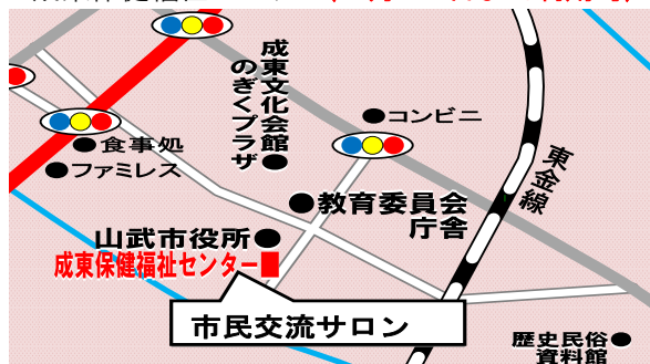
成東保健福祉センター(2月14日まで利用可)