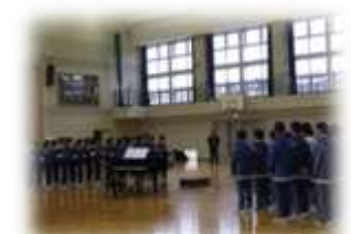
「対面式」（平成30年2月16日） 写真上：レクリエーション、写真下：歌声