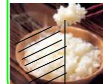
ごはん 1/2杯分 (56g)