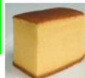
カステラ 1切れ 100g