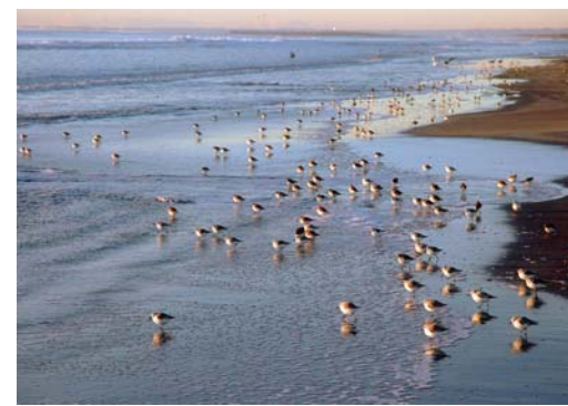
番号 14 撮影場所 関ノ下の海 作品名 ごちそうさがそ！ 作品コメント 沢山の鳥が海にむかって休息?! 海の幸を探してるのか、とても仲良く並んでかわいかったです。