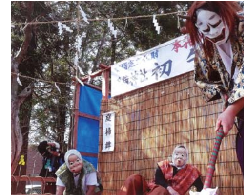
番号 29 撮影場所 松尾町本柏稲荷神社 作品名 神楽 作品コメント 神楽十二座の内、七座の庭きの舞。二人火男が庭はきをしているところに鬼が出て、いじめようとするが、翁が現れ、鬼をいさめて、これを助ける舞。