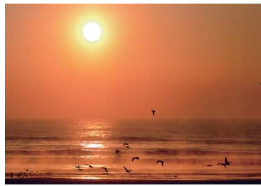
番号 13 撮影場所 関ノ下海岸 作品名 みんなでいこう！ 作品コメント 皆でこれからどんな場所へむかってとんで行くのかな… これからどんな出会いが待っているのかな…新年スタートの日。