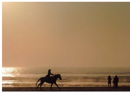
番号 17 撮影場所 山武市関ノ下浜海岸 作品名 優走 作品コメント 初日の出の時の写真です。日は高くのぼったのですが、馬が来るのを信じて、まちつづけて撮った1枚です。