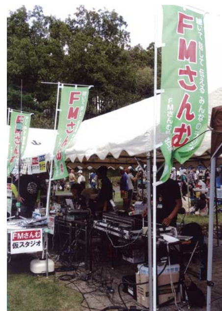
番号 23 撮影場所 さんぶの森公園 作品名 FMさんむ 仮スタジオ 作品コメント さんぶの森の景観、やまのおんぶ、FMさんむ仮スタジオで実況放送ラジオと共に作る街。