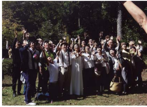
番号 25 撮影場所 さんぶの森公園 作品名 笑顔がいっぱい 作品コメント さんぶの森の景観（やまのおんぶ）森の結婚式。