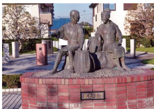
番号 35 撮影場所 伊藤左千夫記念公園 作品名 語らう二人 作品コメント 何を語らう二人が政夫と民子。野辺の憩いの一時か。