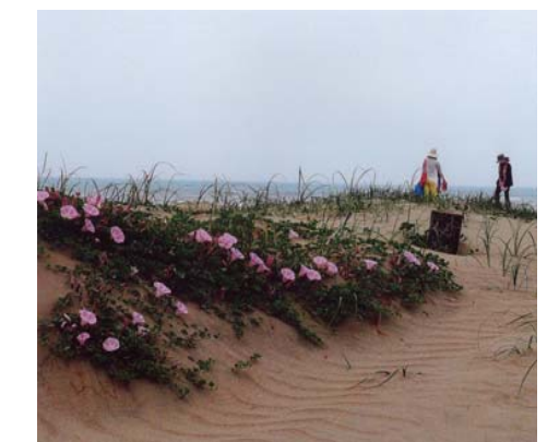
番号 31 撮影場所 蓮沼海岸 作品名 はまひるがお 作品コメント 浜風にふかれて、一面に群生の地蓮沼海岸にて。砂の風紋。花、家族づれを撮った。