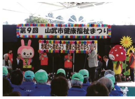
番号 26 撮影場所 あららぎ館 作品名 健康と福祉のまちづくり 作品コメント SUNムシくんやむーちゃんも応援に来てもらって、子供も大人も、えびす顔でした。