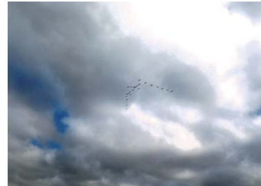
番号 37 撮影場所 作田川 作品名 鳥 作品コメント 日課である昼休みの散歩で目にした鳥の群れです。重たい空の中を軽やかに飛ぶ鳥の姿におもわず魅入ってしまいました。