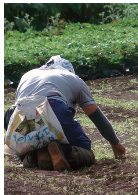
番号 24 撮影場所 山武市沖渡 作品名 農作業 作品コメント 早朝散歩で見かけた農作業の風景。