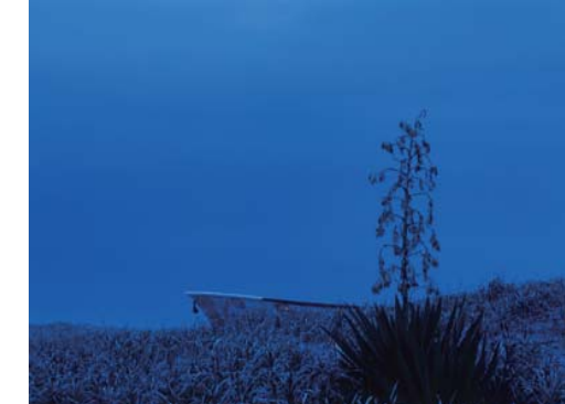
番号 16 撮影場所 山武市関ノ下浜海岸 作品名 静寂 作品コメント 初日の出を撮りにきたのですが雲が出ていたので古船を入れて撮りました。