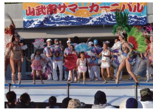
番号 27 撮影場所 山武市蓮沼 作品名 お姉さんと、いっしょに 作品コメント プロのダンサーに勝るとも劣らぬ動きで懸命に踊る少女等に思わず拍手してしまい、シャッターを押すのも忘れたほどでした。このイベント来年も楽しみにして居ます。毎年続けて下さい。