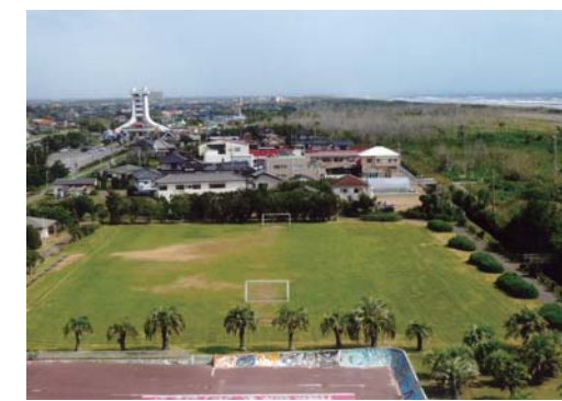
番号 21 撮影場所 蓮沼海浜公園 作品名 蓮沼海浜公園 作品コメント 山武市蓮沼海岸4kmにわたる蓮沼海浜公園の最南端のローラーボード場とサッカー場から展望台を望みます。