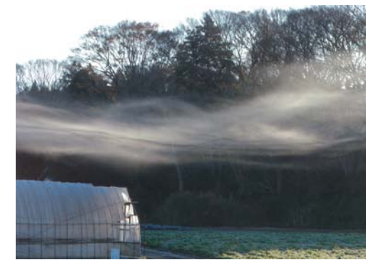
番号 33 撮影場所 山武市沖渡 作品名 朝もや 作品コメント 早朝散歩で出会った畑にたなびく朝もやの風景。