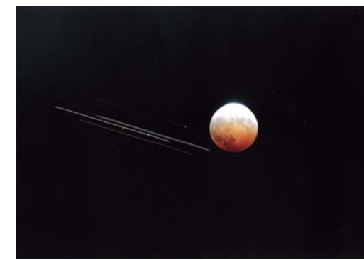
番号 15 撮影場所 山武市松ヶ谷 作品名 光の共演 作品コメント 自宅庭から撮影した皆既日食です。当日は18:30～21:30までの3時間庭でねばっていました。月が赤くなったときに飛行機の明りと皆既日食を低速シャッターで写し込みました。