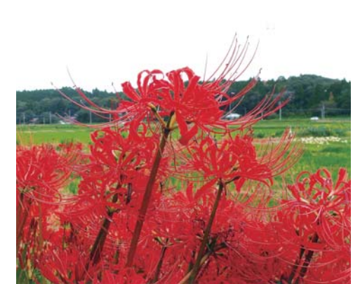
番号 30 撮影場所 松尾町山室地先 作品名 彼岸花 作品コメント 彼岸花、ヒガンバナ科の多年草。農道に50m位に渡って咲いていた。(白色の彼岸花もある)