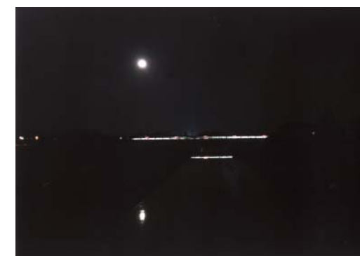
番号 38 撮影場所 作田川（平成大橋） 作品名 作田川 作品コメント スーパームーンの日に月を撮影しましたが、スマートフォンでは月がうまく撮影できず、被写体を作田川に変更しました。