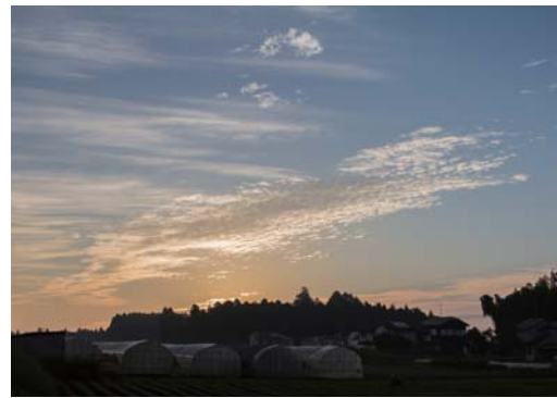
番号 18 撮影場所 山武市沖渡 作品名 夜明け 作品コメント 自宅の庭から見る何げない毎日の風景ですが、四季を通じ色々な表情をします。一日の始まり。初秋の畑の暁が美しく撮れました。