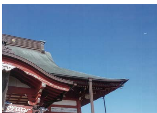
番号 39 撮影場所 山武市松ヶ谷 作品名 勝覚寺と秋の青空 作品コメント 江戸時代初期に建てられた勝覚寺の釈迦堂には、四天王四尊が納められています。これら2mを超す四天王様を秋田県から訪れた友人を案内していたとき、ふと見上げた空の青色、屋根の緑青色、垂木の朱色のコントラストが美し過ぎて思わず撮影した1枚です。