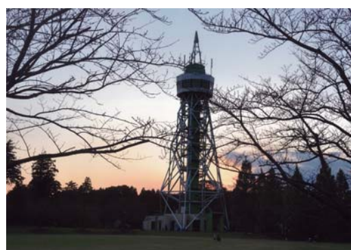
番号 36 撮影場所 さんぶの森公園 作品名 夕映え 作品コメント 人気の少なくなった夕暮れ時、落日に浮かぶ、さんぶタワーの骨格を写す。