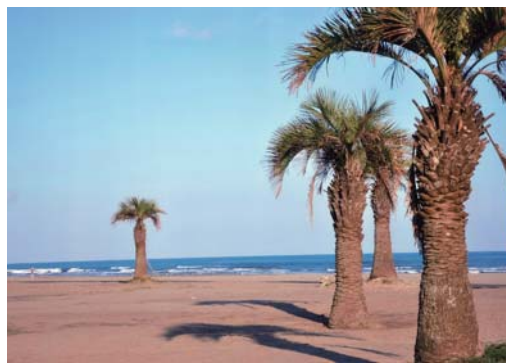
番号 34 撮影場所 本須賀海岸 作品名 晩秋の浜 作品コメント 日差しの柔らかい午後空の青さと海の青さが交叉する。