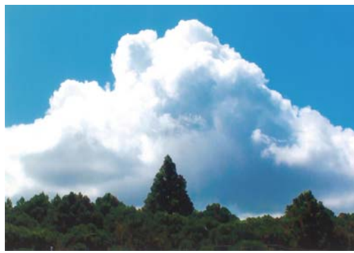
番号 12 撮影場所 沖渡 作品名 入道雲 作品コメント 真青な大空に天高く伸びる入道雲は真夏の象徴でもある。それに負けじとガンバル山武杉。ガンバレ、ガンバレ山武杉。