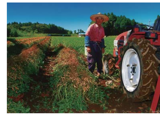
番号 28 撮影場所 自宅の裏の畑 作品名 わが家の大黒柱 作品コメント 私がちょっとぶり手傳うくらいで、ほとんどぢいちゃんが作業を1人でしています。いつまでも元気でと、祈る気持ちです。