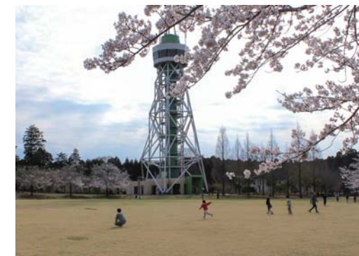
番号 20 撮影場所 山武の森 作品名 春麗らか 作品コメント 五分～七分咲きの桜の下で、子供達がうらやかに、楽しそうに遊んでいる様です。