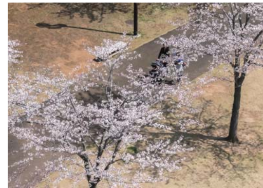
番号 19 撮影場所 山武の森 作品名 桜満開 作品コメント 満開の桜の下を、のどかに散歩している様を、塔の展望台から俯瞰し、撮影しました。