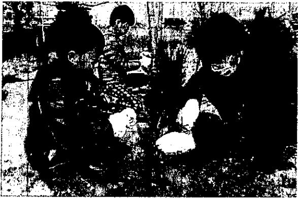
元気に育てと心を込めて植樹

3月14日(土)、東日本大震災被災地である蓮沼海浜公園(山武市蓮沼)において、第2回さんむスプリングフェスタを開催。山武市内をはじめ関東近県から小中学生や親子が参加。