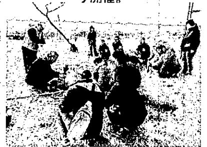
ボランティアの方が植え方を説明

植樹祭は平成22年度から実施し、合計クロマツ、常緑広葉樹 23,600本を植樹した。