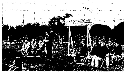
椎名市長 あいさつ

本植樹祭は、(公社)国土緑化推進機構の「緑の募金・東日本大震災復興事業」、(一財)千葉県環境財団の「ちばの海岸保安林等の保全・再生活動支援事業」の協力により開催。