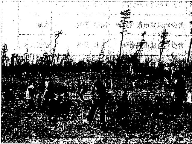
10区画に分かれてクロマツを植樹

平成25年度に植樹した県有林に、3年生抵抗性クロマツ3,000本を補植。植樹祭には、220人が参加。