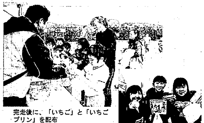
完走後に、「いちご」と「いちごプリン」を配布

主催: さんむスプリングフェスタ実行委員会 山武市青少年育成市民会議 後援: 千葉県 山武市 東金市 大網白里市 九十九里町 芝山町 横芝光町 山武市教育委員会 山武市観光協会 山武市成東観光会 山武市商工会 山武市朝市組合 山武郡市農業協同組合 山武市PTA連絡協議会 山武市教頭会 山武市子ども会育成連絡協議会 山武市青少年相談員連絡協議会 山武市区長会連合会 山武市社会教育委員会 山武市婦人会 山武市交通安全協会 山武市民生委員児童委員協議会 山武市保護司会 山武市社会福祉協議会 山武市ゴールドクラブ連合会 山武市防犯パトロール隊 山武市さくらの会 山武市体育協会 山武市スポーツ推進委員連絡協議会 山武市少年スポーツクラブ連合会、NPO法人コミュニティサービス地球座 成東小学校PTA 大富小学校PTA 南郷小学校PTA 緑海小学校PTA 鳴浜小学校PTA 日向小学校PTA 磯岡小学校PTA 山武北小学校PTA 山武西小学校PTA 蓮沼小学校PTA 豊岡小学校PTA 大平小学校PTA 松尾小学校PTA 成東中学校PTA 成東東中学校PTA 山武中学校PTA 山武南中学校PTA 蓮沼中学校PTA 松尾中学校PTA 県立成東高等学校PTA 県立松尾高等学校PTA (順不同) 協力: 千葉県北部林業事務所 (公社)国土緑化推進機構 (一財)千葉県環境財団 千葉県レクリエーション都市開発局