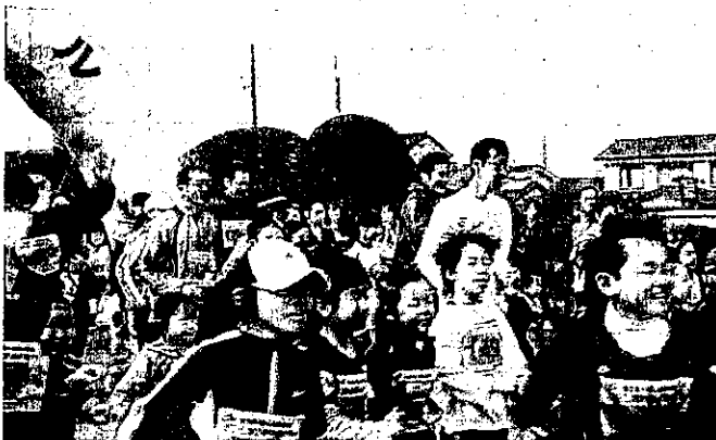
元気にジョギング!

津波の被災地(海岸線)を1.5km、3km、5kmの3部門に分かれて630人が自分のペースでジョギングをおこなった。