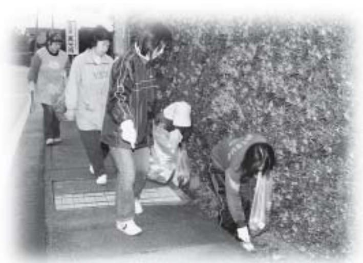
家族総出のごみゼロ運動