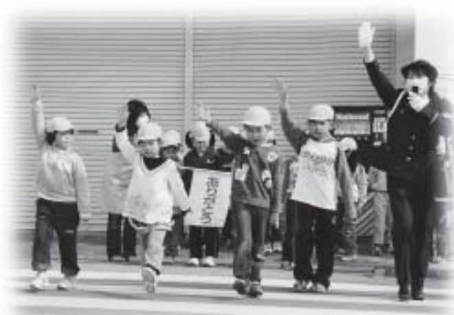
手をあげて右！左！交通安全教室