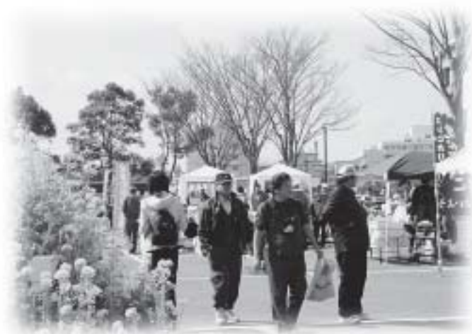
「もうすぐ春ですね…」なのはなまつり