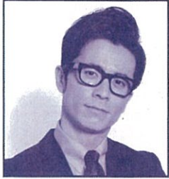
ゲストランナー 藤森 慎吾 さん (ふじもり しんご)

日程 受付(当日) 7:30~9:30 開会式 8:20 競技開始 9:00 表彰式:種目別に随時