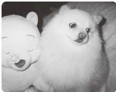
名前 斉藤 マック (五木田)

性格 生後1か月でわが家に来てもう4年。少し臆病なところがありますが、いつも私たち家族を癒してくれるやさしい子です。