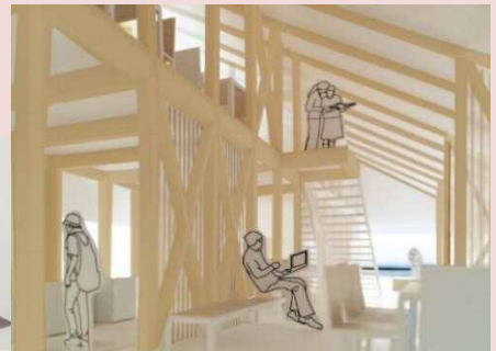
待合室内観イメージ