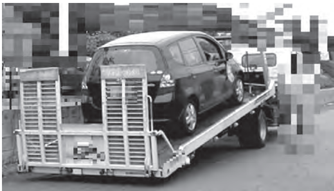
※差し押さえた自動車の引き揚げ