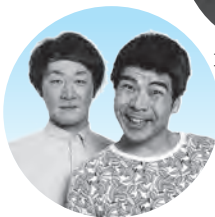
インポッシブルさん