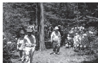
▶ アジサイの時期にはたくさんの人が

このコンサートでは、お年寄りから小さな子どもたちまで幅広く参加しています。平成26年度に開催した大富小学校吹奏楽部と和太鼓「歩」等による演奏には120人以上の参加がありました。