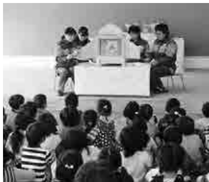
防災紙芝居を見る園児たち

避難訓練を行ったあと、火事が起きた時にどういった「おやくそく」があるか園児たちは熱心に聴いていました。