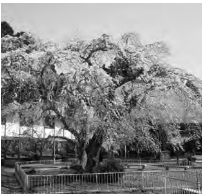
妙宣寺のしだれ桜。見頃は3月下旬