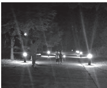
夜の図書館たんけん