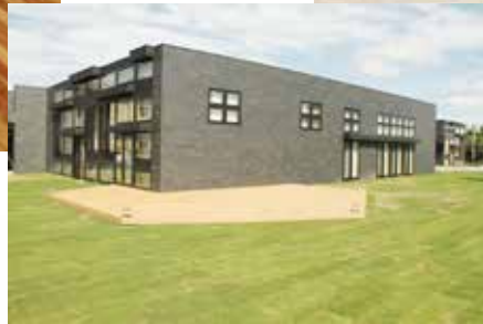
憩いの広場とステージ