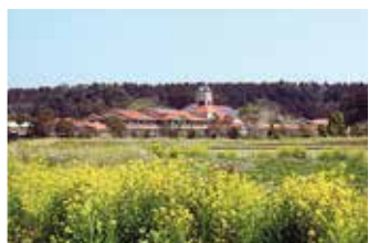
▲「時計台の有る学舎」