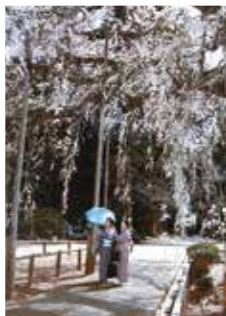
▲「長光寺のしだれ桜」