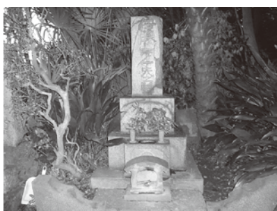
写真1 伊藤左千夫墓所

伊藤左千夫は大正二（一九一三）年七月三十日に脳溢血で深夜昏睡状態になり、同日午後六時家族に見守られて五十歳の生涯を閉じました。三十一日・八月一日の両日、本所茅場町の『唯真閣』で通夜を営み、八月二日午後三時に出棺、亀戸普門院にて告別式を行って今年（二〇一三）で一〇〇回忌となります。