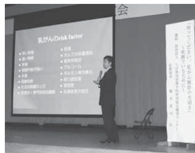
講演を行う橋本先生