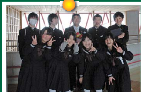
帰りの会の後、先生と記念撮影