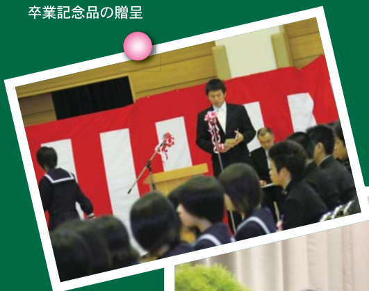
一人ひとりの名前を 読み上げる担任の先生