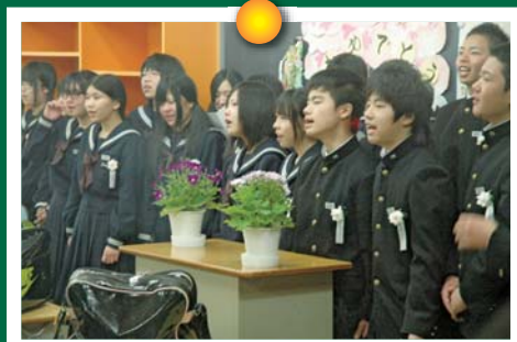
みんなで歌うのがこれが最後