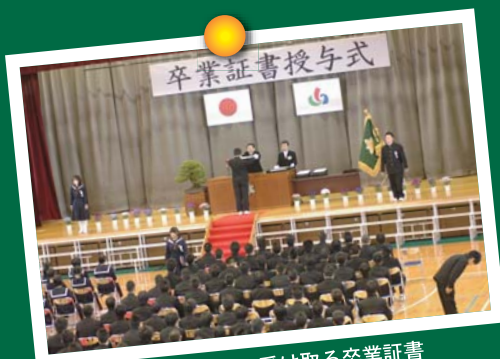
万感の思いで受け取る卒業証書