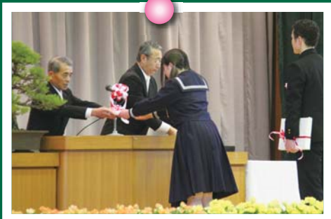
卒業記念品の贈呈

山武南中学校111人、蓮沼中学 校44人、松尾中学校109人は、 それぞれの選んだ道へと、歩き出 しました。