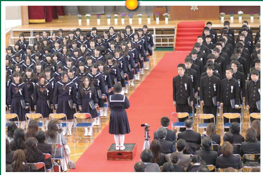
心のこもった送辞に聞き入る卒業生

体に馴染んだ制服も、今日で着納め。通いなれた校舎も、明日からは違うことはない。 ありふれた日常が、大切な思い出に変わる卒業の日。