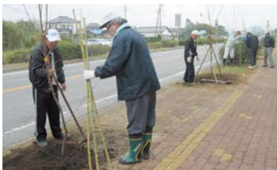
桜の苗木が育つよう支柱を立て固定

これを受け、観光協会やロングビーチ癒しの九十九里街道パートナーシップなどのボランティア団体は植栽後の苗木を支える竹支柱約300本を切り出し、蓮沼海浜公園前の市道蓮沼公園第1号線や蓮沼海浜公園内に、春にも人が訪れることを祈りつつ、協力して植栽に汗を流しました。