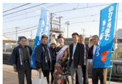
九十九里地域観光連盟の皆さん