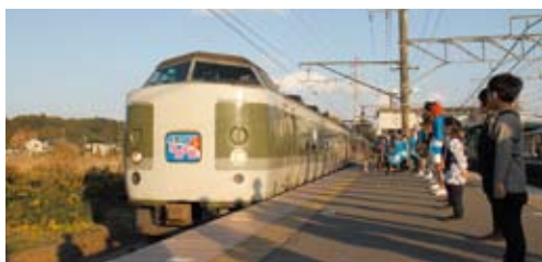
ぐるっとゆめ半島号のお出迎え

この列車の旅では、両国を出発9つの主要駅で車内や停車中のホーム上で各地域のおもてなしやイベントが行われました。成東駅では九十九里地域観光連盟のおもてなしが用意され、ホームでは、椎崎三匹獅子舞の披露、車内では地域の特産物が乗客にふるまわれました。乗客から「おもてなしがとても気持ちよかった」「もう一度千葉に来たいです!」の感想がありました。