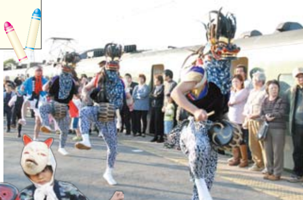
椎崎三匹獅子舞を見入る乗客