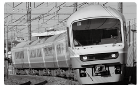
▲お座敷列車「ニューなのはな号」