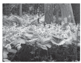
クマガイソウ (ラン科)

5月〜7月に見られる植物は、モウセンゴケ、コモウセンゴケ、イシモチソウなどが見られます。他にはトクソウ、ノアザミ、ミズドリなども見られますので、まだ見学していない人はぜひご覧ください。8月末日までは毎日監視員が説明してくれますので来場時には、監視員に声をかけてください。なお、団体予約も行っています。