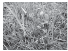
モウセンゴケ (食虫植物)

食虫植物群落は、大正9年7月に「成東町肉食植物産地」の名称で指定されました。そして昭和53年に名称変更がなされ、現在の食虫植物群落として親しまれています。