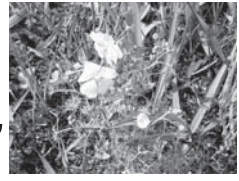
イシモチソウ (食虫植物)